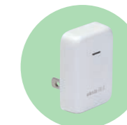
ビーコンレシーバ