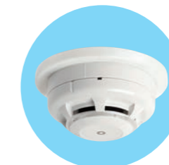
感知器接触型ビーコン