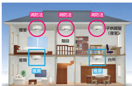
(例)消防法による設置義務のある部屋

消防法では、「全ての寝室」と「階段」に煙式の警報器を設置することが義務付けられています。その他の部屋については、各市町村の条例に基づいて取り付けください。2階建ての場合は、2階の階段の降り口の天井または天井に近い壁に取り付けると、より効果的です。