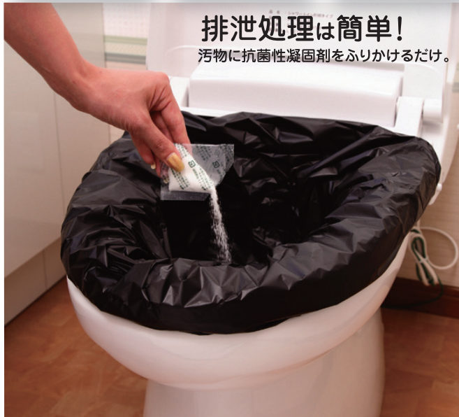
排泄処理は簡単! 汚物に抗菌性凝固剤をふりかけるだけ。